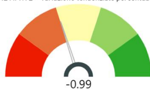
IMPRESE ARTIGIANE ATTIVE - Variazione tendenziale percentuale dello stock