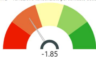
IMPRESE ATTIVE - Variazione tendenziale percentuale dello stock